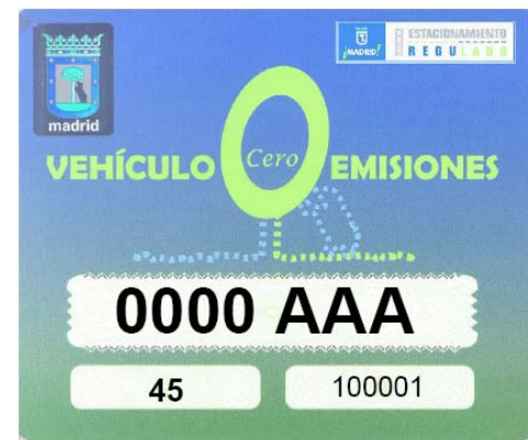
Distintivo "Cero Emisiones"

*Según Acuerdo del Pleno, de 22 de diciembre de 2010, por el que se aprueba la modificación de la Ordenanza Fiscal Reguladora de la Tasa por estacionamiento de Vehículos en Determinadas Zonas de la Capital y su posterior anuncio de rectificación de fecha 14 de enero de 2011 (B.O.C.M. núm. 311, 30 de diciembre de 2010, página 438 y B.O.C.M. núm. 11, 14 de enero de 2011, página 323.)